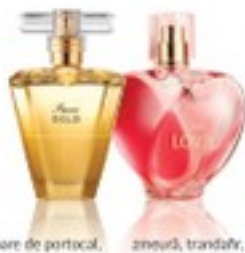
floare de portocal, bergamotă, amber zmeură, trandafir, lemn de cășmir