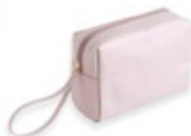
Geantă pentru cosmetice Hope

Argintie. Exterior din PU, căptușeală din poliester. Aprox. 20 cm x 8 cm x 14 cm.