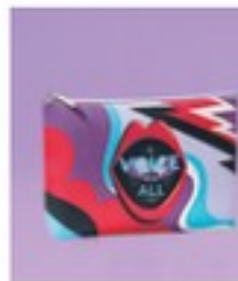
Geantă pentru cosmetice DV Poliester. Aprox. 21,5 x 15 cm.

* Studiul "Iubirea și abuzul la Gen Z & Alpha" 2024, realizat de Fundația Friends for Friends și Reveal Marketing Research