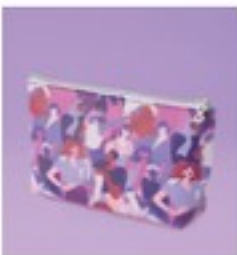
Geantă pentru cosmetice DV PU exterior. Aprox. 23 x 13 x 6 cm.