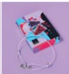
Brățară DV Mau Plăcătă cu argint. Poliester, zinc, nichel. Ajustabilă.