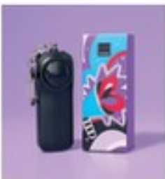
Alarmă portabilă Alu, zinc. Dim. aprox. 8,5 x 3 x 2 cm. Necesită 2 baterii AAA (nu sunt incluse)