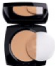
Pudră compactă matifiantă True Colour Flawless