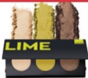
Paletă de farduri Your Power