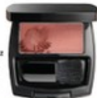
Fard de obraz True Colour