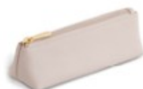
Etui pentru pensulele de machiaj

Roz. PU. Dimensiuni aprox. 20cm x 6cm x 6cm.