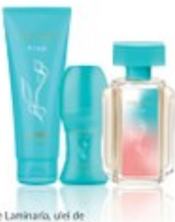
alge Laminaria, ulei de bergamotă italian, amber