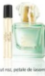
ghețuri roz, petale de lăzime, mosc