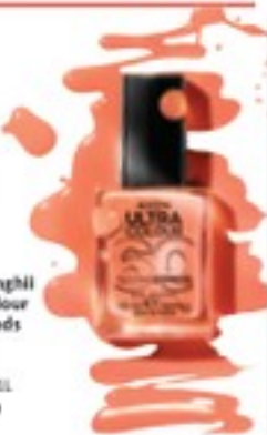
Lac de unghii Ultra Colour 60 Seconds Express