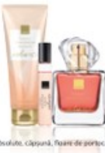
Rose Absolute, căpșună, floare de portocal