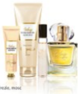
neroi, fructe, mosc