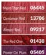
Ruj lichid Power Stay 6 ml | 3331.67/1L