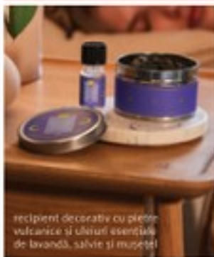
recipient decorativ cu pietre vulcanice și uleiuri esențiale de lavandă, salvie și mușetel

Pentru o experiență parfumată și calmă de aromaterapie, adăugă câțiva stropi de ulei pe pietrele vulcanice.