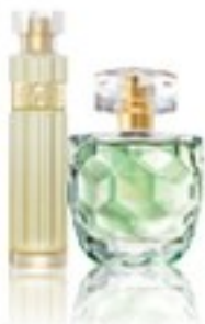
magnolie, lăsoaică, gardenie