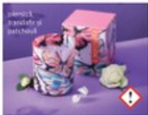
plămîc, trandafiri și patchouli