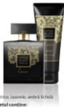
citric, lăsoaică, ambra lichidă