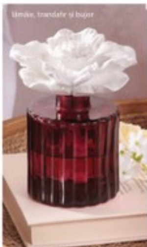
lămâie, trandafiri și bucur