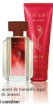
mure, acori de trandafir regal, mosc de anason