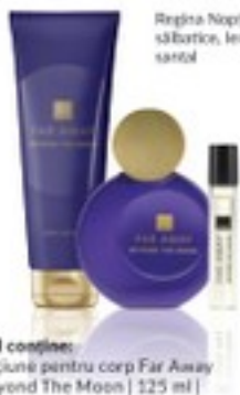
Regina Noptii, ciresa sălbatică, lemn de santal