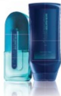
note coriace, mentă, vetiver