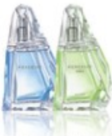
pară, frezie, mosc